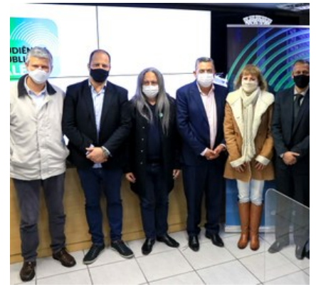
Encontro reuniu autoridades da região

Também de Osasco, o munícipe Mário Chiba sugeriu investimentos para fomentar a atividade dos Microempreendedores Individuais (MEIs). Ele propôs